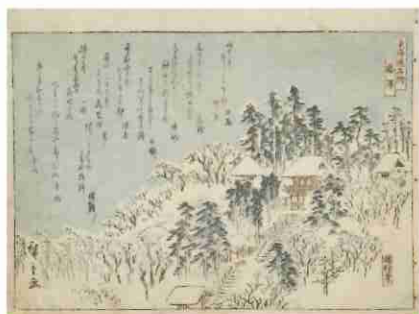
歌川広重「東海道名所 藤沢 遊行寺」