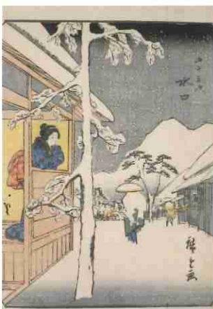
歌川広重「五十三次 水口」 (人物東海道)