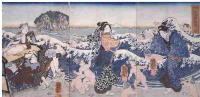
歌川芳雪「相州江之島詣春の賑」

歌川広重(一七九七-一八五八)は、東海道の揃物(シリーズ)を二十種余り描きました。当時の旅ブームもあり、「東海道五拾三次之内」(保永堂版)が大ヒットしたことで、その後多くの版元たちから広重に東海道を主題にした揃物の制作依頼があったためです。人々を飽きさせない広重の創意あふれる工夫もあって、多様な東海道の揃物が次々と刊行されました。 今回の展示では、各宿場の風景とともに細やかな人物描写が特徴の「五十三次」(通称「人物東海道」)を中心に、広重が描く当時の旅の様子、風物や季節を紹介します。「人物東海道」から広重が描く当時の情景をお楽しみください。