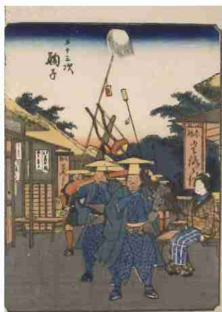
歌川広重「五十三次 鞠子」 (人物東海道)