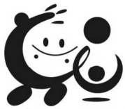
「仕事と介護を両立できる職場環境」の整備促進のためのシンボルマーク トモニン