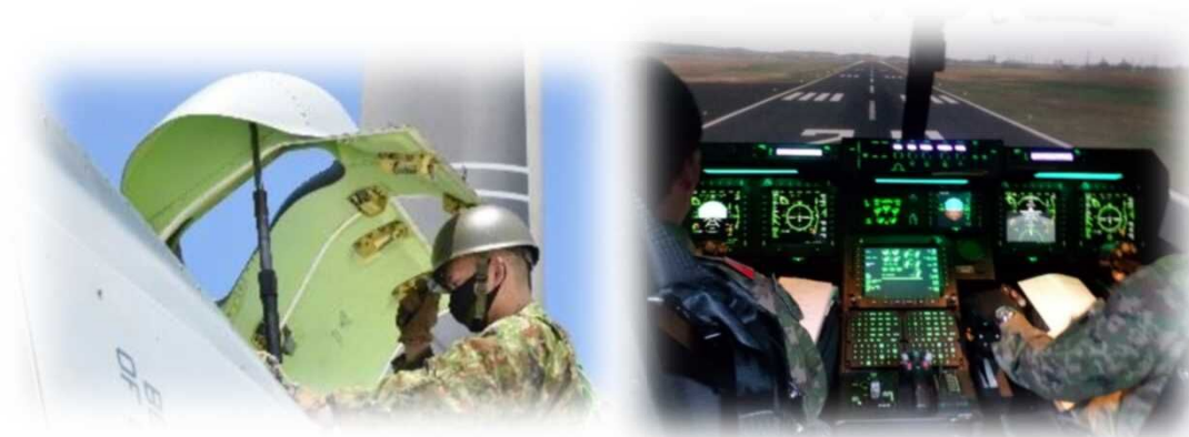
安全対策措置の様子（イメージ）

日々の飛行の際に事前に作成する運用計画についても、「特定の部品の不具合」による事故を防ぐための手順を整理し、この計画に反映させます。