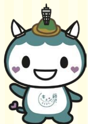
「キュンとするまち。藤沢」 公式マスコットキャラクター ふじキュン♡