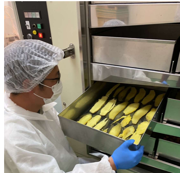
サツマイモを減圧乾燥する様子