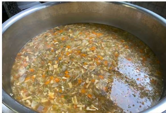
片瀬小学校で提供した給食