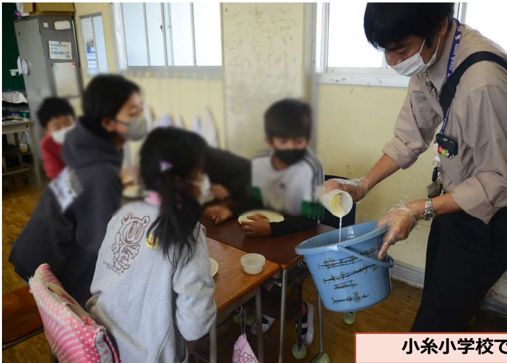
小糸小学校での授業の様子