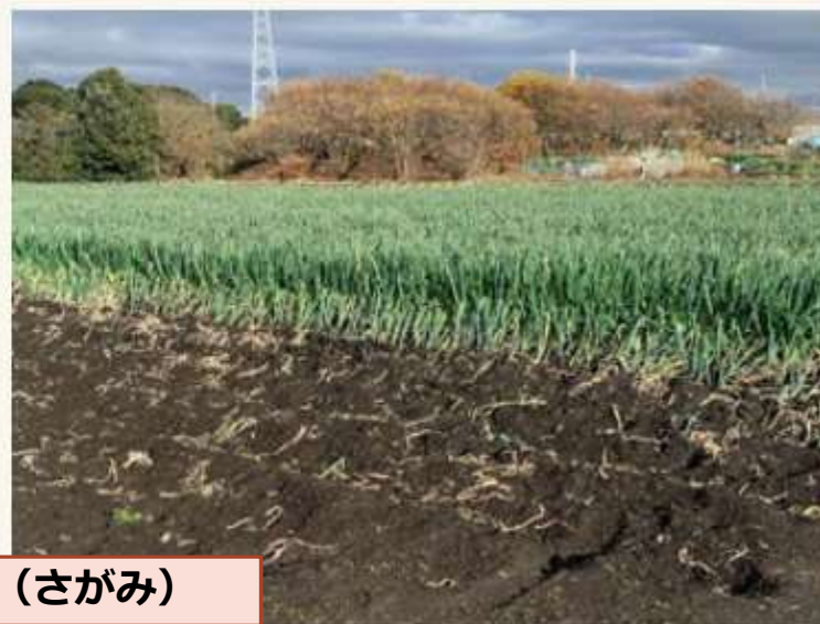
湘南土ねぎ（さがみ）