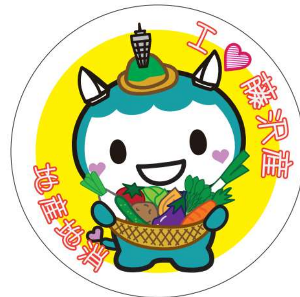
量販店の設置状況及び今年度作成したPOPのデザイン