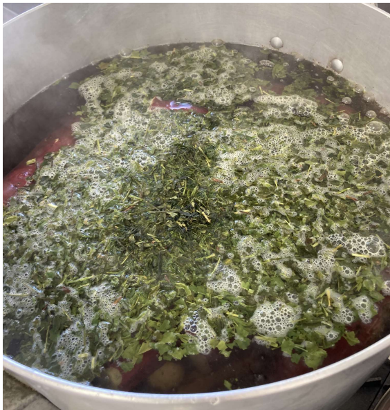
お茶でサツマイモを茹でる様子