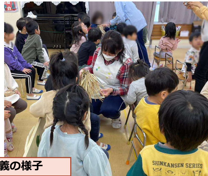
俣野保育園での講義の様子