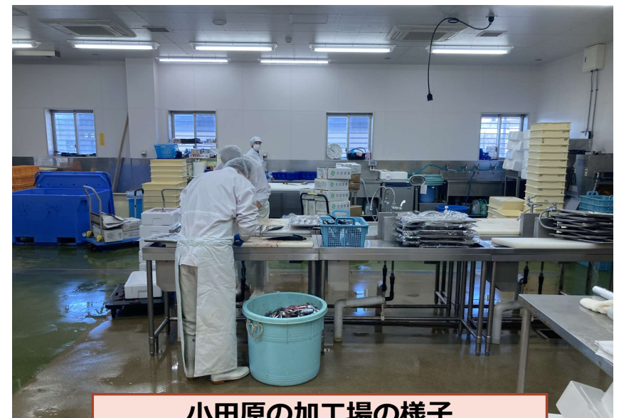
小田原の加工場の様子