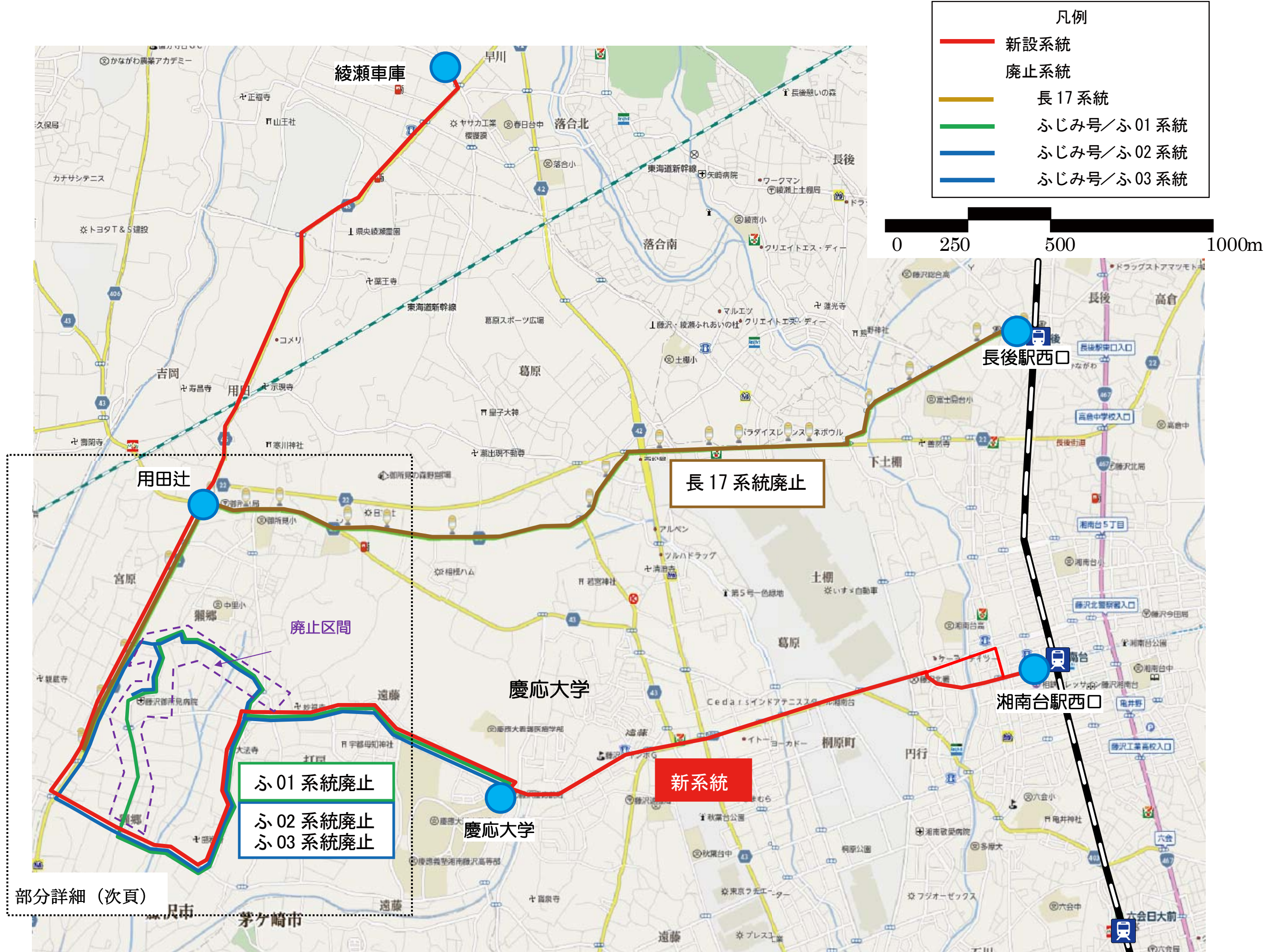
路線・系統図 (広域)