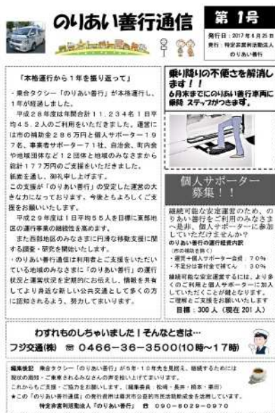
のりあい善行通信