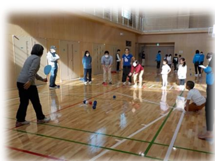
昨年度開催のようす