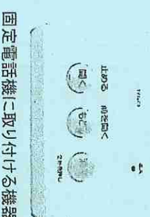
固定電話機に取り付ける機器