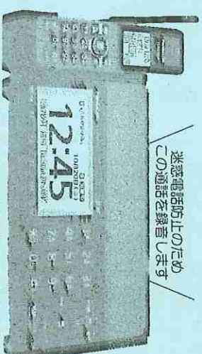
迷惑電話防止機能付き固定電話機

次の全てに該当する方 ☆市内在住の70歳以上で、市税の滞納がない方 ☆2021年4月1日以降に対象機器を購入した方