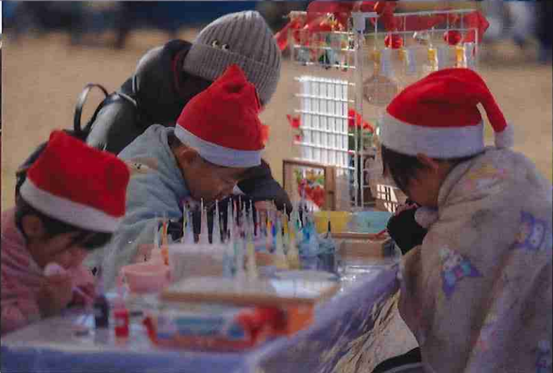
※12月クリスマスマーケット時の写真となります