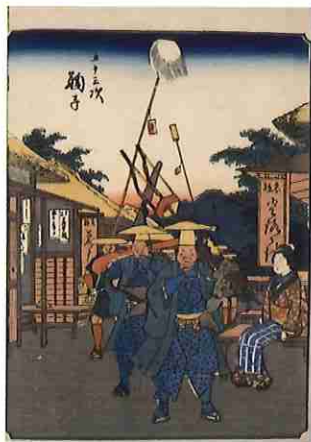
歌川広重「五十三次 鞠子」 (人物東海道)