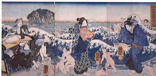
歌川芳雪「相州江之島詣春の賑」

歌川広重(一七九七-一八五八)は、東海道の揃物(シリーズ)を二十種余り描きました。当時の旅ブームもあり、「東海道五拾三次之内」(保永堂版)が大ヒットしたことで、その後多くの版元たちから広重に東海道を主題にした揃物の制作依頼があったためです。人々を飽きさせない広重の創意あふれる工夫もあって、多様な東海道の揃物が次々と刊行されました。今回の展示では、各宿場の風景とともに細やかな人物描写が特徴の「五十三次」(通称「人物東海道」)を中心に、広重が描く当時の旅の様子、風物や季節を紹介します。「人物東海道」から広重が描く当時の情景をお楽しみください。