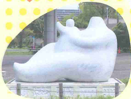
熊坂兒子<核兵器廃絶平和祈念像>1995年