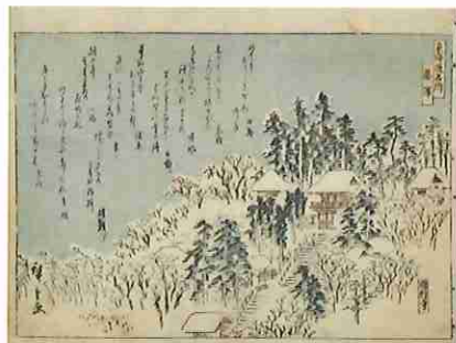
歌川広重「東海道名所 藤沢 遊行寺」