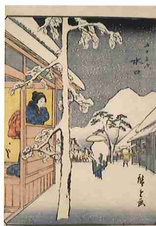
歌川広重「五十三次 水口」 (人物東海道)