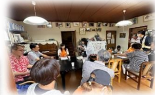
↑ 東海岸3丁目町内会でのパトロール後、課題の報告と今後の取り組みについての協議の様子