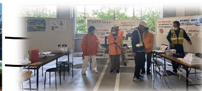
体験ブースの様子