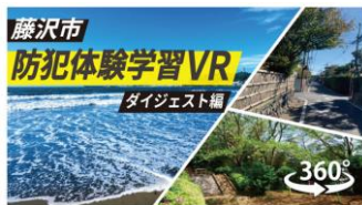
藤沢市防犯体験学習VR

当日は、今話題のVRと防犯活動との組み合わせも新しく、興味を持たれる方が多く、両日合わせて144名の方に体験いただき、防犯を身近に感じていただきました。