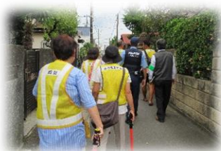
東町町内会でのパトロールの様子 ↓