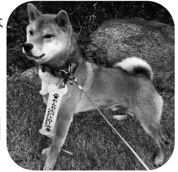
リード標と、 パトロール中のわんちゃん