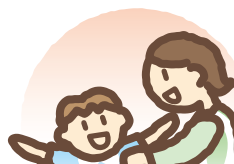
保育園での保育サービス