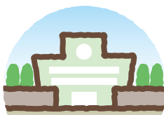
小・中学校の管理