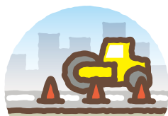
道路の建設・維持管理