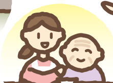
高齢者への福祉サービス