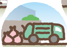
ごみ・資源の収集